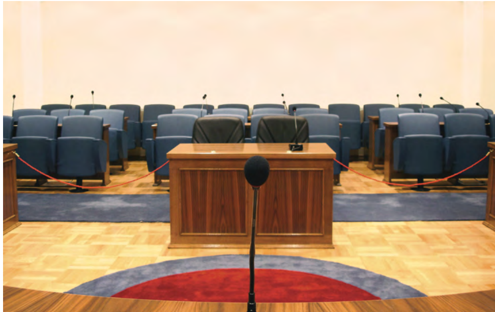
Sala za održavanje plenarnih sjednica i javnih rasprava Plenary Session and Public Hearing Room

Kada je u postupku pred Ustavnim sudom potrebno izravno raspraviti pitanje značajno za donošenje odluke, Ustavni sud će u plenarnoj sjednici održati javnu raspravu.