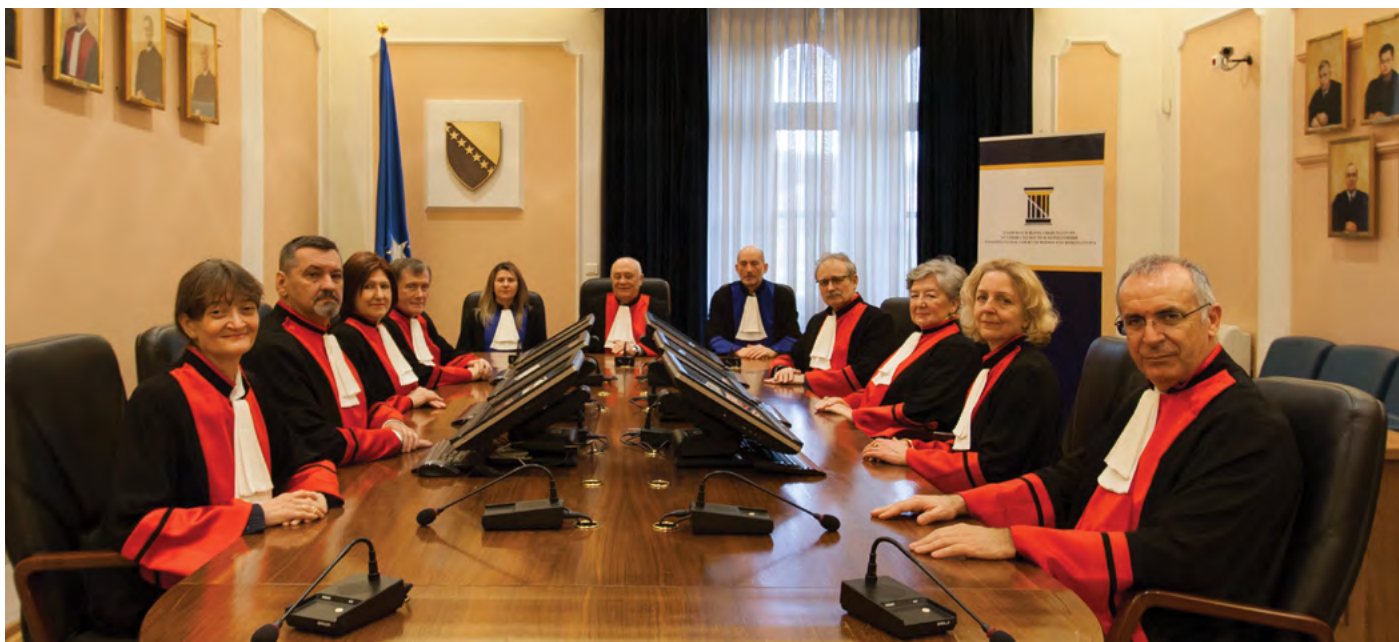
Суткиње, судије, генерални секретар и регистар Уставног суда у сали за вијећање Judges, Secretary General and Registrar of the Constitutional Court in the Deliberation Room

скупштине, једна четвртина чланова било ког вијећа Парламентарне скупштине или једна четвртина било ког законодавног вијећа неког ентитета.