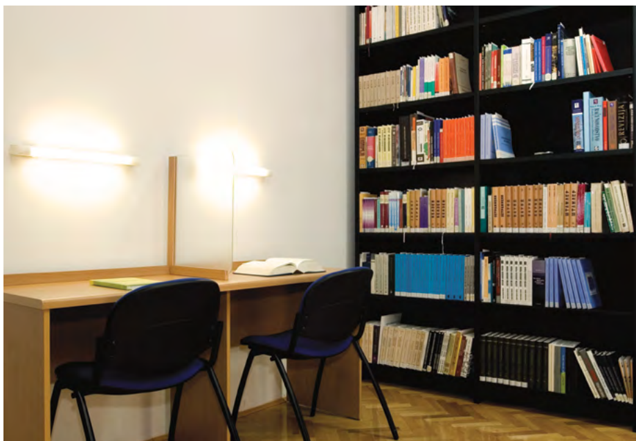
Čitaonica Biblioteke Ustavnog suda Reading Room in the Library of the Constitutional Court

Biblioteka Ustavnog suda BiH omogućava sudijama Ustavnog suda, pravnim savjetnicima i stručnim saradnicima da prate razvoj naučne misli u oblasti ustavnog prava, kao i da budu u toku sa praksom Evropskog suda za ljudska prava i praksom evropskih ustavnih sudova i drugih sudova jednake nadležnosti.