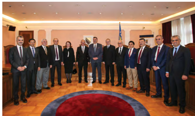
Делегација Суда за рјешавање сукоба надлежности Републике Турске у посјети Уставном суду Босне и Херцеговине, Сарајево, новембар 2019. године