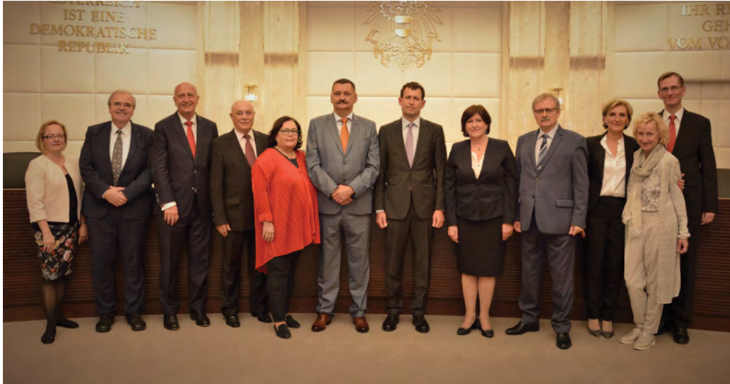
Делегација Уставног суда БиХ у радној посјети Уставном суду Републике Аустрије, Беч, септембар 2019. године

Delegation of the Constitutional Court of BiH on working visit to the Constitutional Court of the Republic of Austria, Vienna, September 2019.