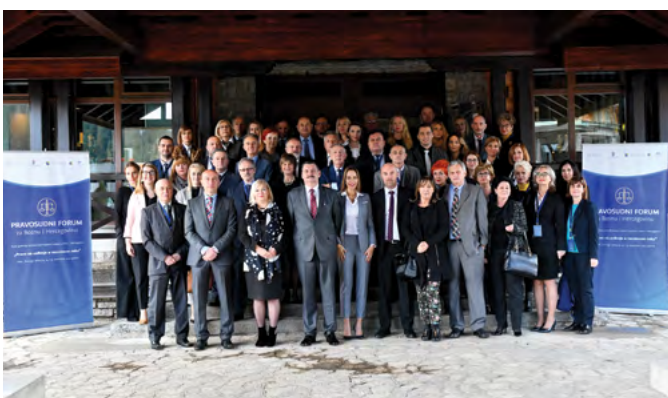
Учесници Треће годишње конференције највиших судова у Босни и Херцеговини, Јахорина, новембар 2019. године

Као наставак регионалне сарадње, Уставни суд Босне и Херцеговине, у сарадњи и уз финансијску подршку Њемачке фондације за међународну правну сарадњу (IRZ), организовао је у протеклом периоду двије регионалне конференције: „Слобода вјероисповијести у уставно-судској пракси“ у Теслићу (октобар 2019) и „Издвојена мишљења у уставним одлукама“ која је одржана online (децембар 2020).