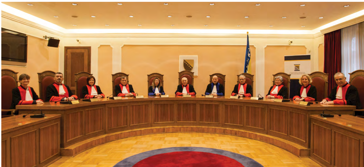
Суд у пленарном сазиву Plenary Court