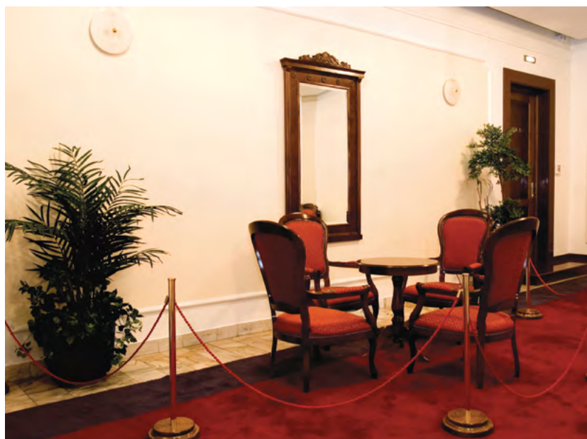
Hol ispred sala Ustavnog suda Hall in front of the Session Rooms of the Constitutional Court

Owing to the donations received in the past from the governments of the United States, Republic of Austria, Greece, Great Britain, Republic of France, Kingdom of Spain, Kingdom of Sweden, Federal Republic of Germany and Kingdom of Norway as well from the European Commission and ICITAP, the Constitutional Court managed to renovate its premises, improve the information system and its publishing capacities as well as restock the library.