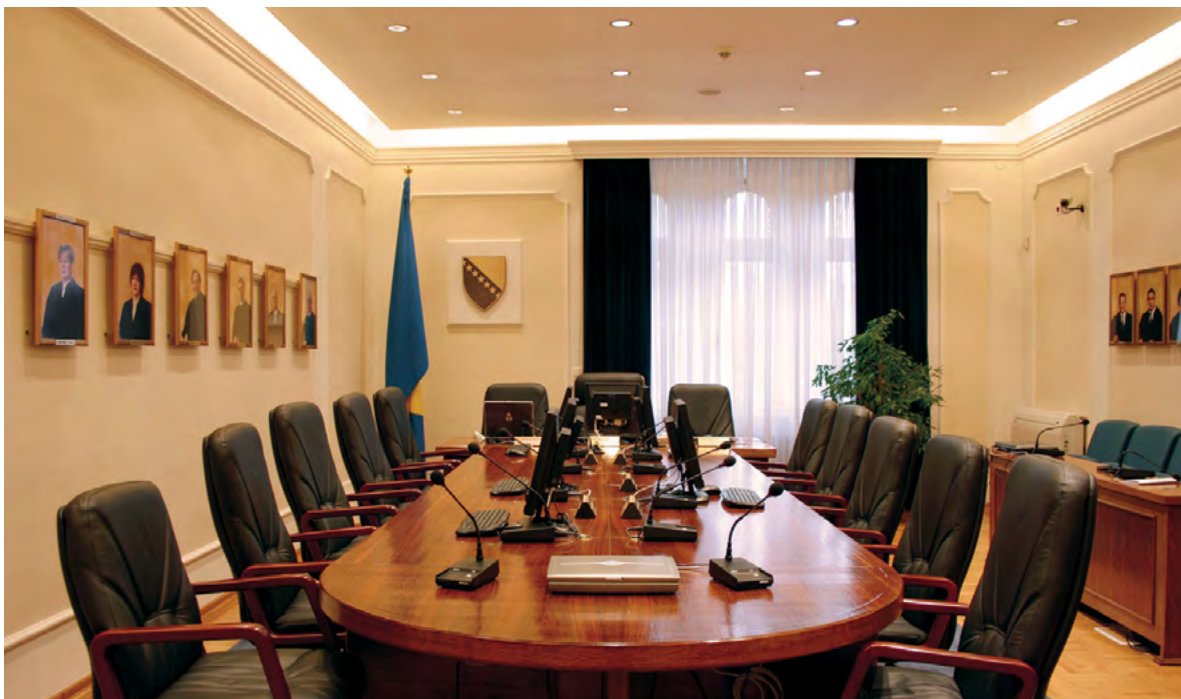
Sala za održavanje sjednica vijeća Ustavnog suda Constitutional Court Chambers' Session Room

(Article IV(3)(e) and (f) of Constitution of BiH)