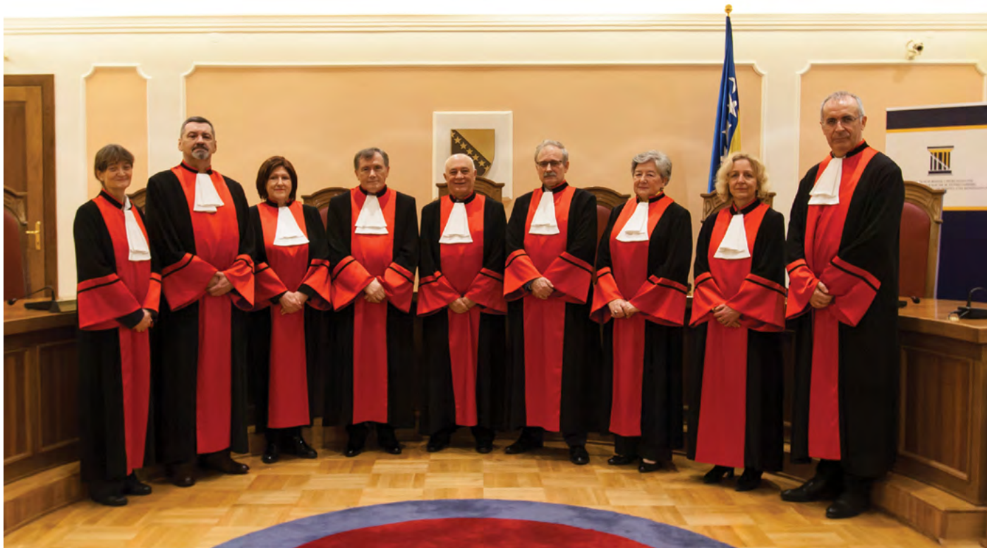
Sutkinje i suci Ustavnog suda Judges of the Constitutional Court

Prije preuzimanja dužnosti svaki izabrani sudac na prvome zasjedanju Ustavnoga suda u plenarnoj sjednici kojoj je taj sudac nazočan ili, u slučaju potrebe, pred predsjednikom Ustavnoga suda daje i potpisuje sljedeću svečanu izjavu: