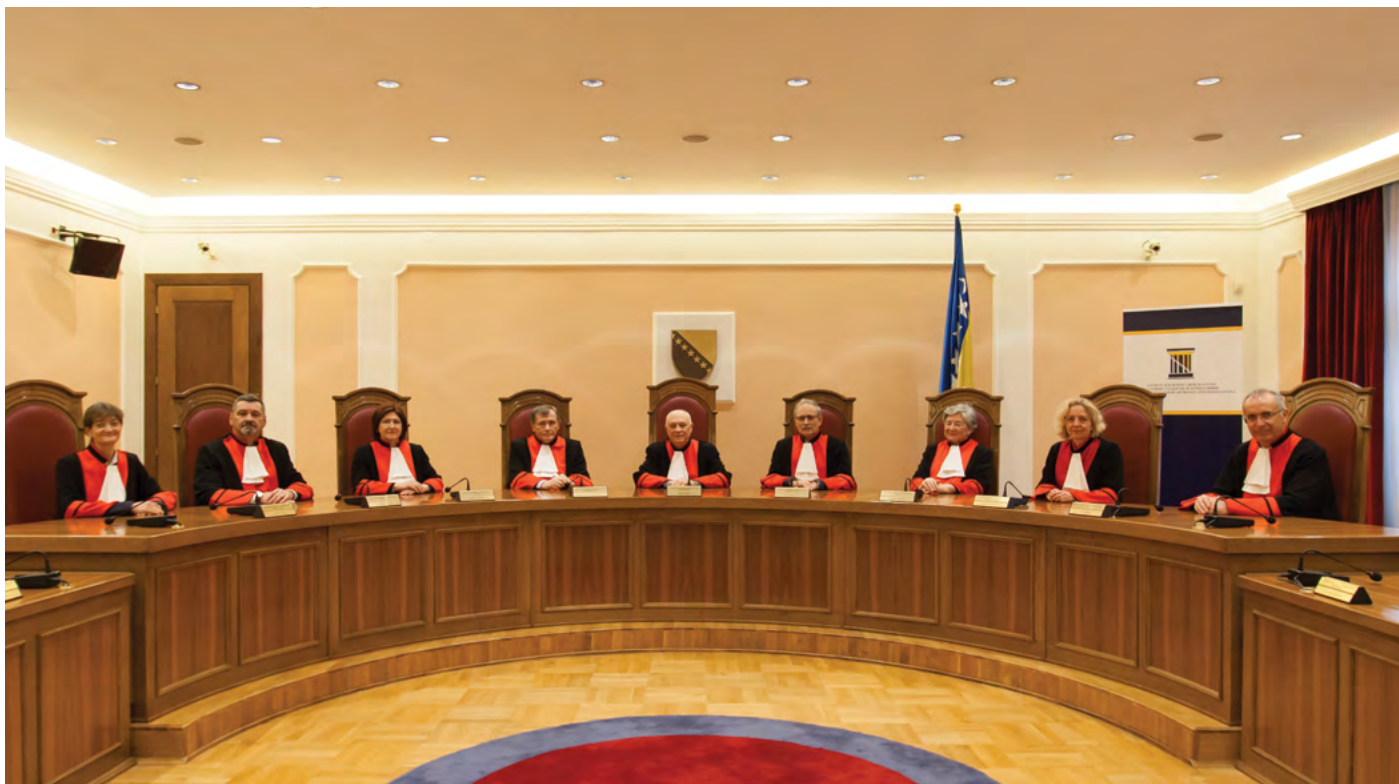
Суткиње и судије Уставног суда Judges of the Constitutional Court

Предсједник Уставног суда се бира на пленарној сједници тајним гласањем ротацијом судија које су изабрали законодавни органи ентитетa из члана VI/1а) Устава БиХ с тим да у два узастопна мандата предсједник Уставног суда не може да буде из реда конститутивног народа или Осталих из ког је био претходни, нити предсједник прије њега.