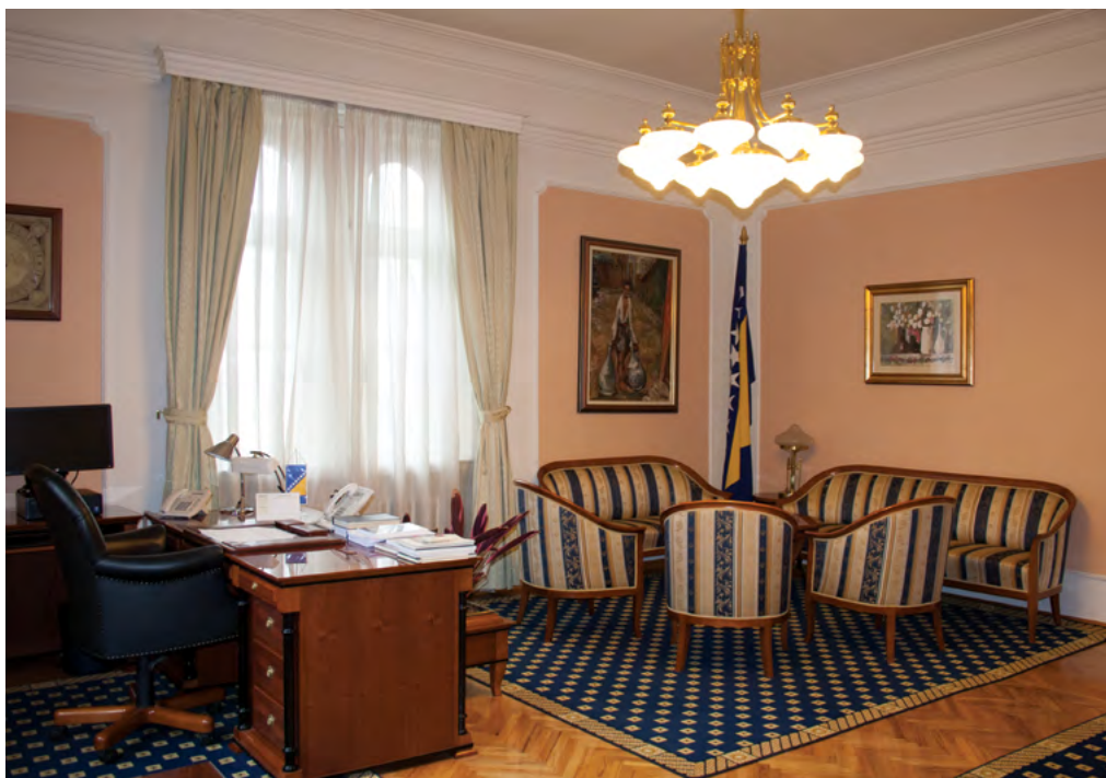
Kabinet predsjednika Suda

Regardless of the very high level of human rights protection, the Constitutional Court will continue to work to raise these standards and work efficiency. It has to be noted, though, that today the Constitutional Court of BiH has no pending cases that are more than two years old.