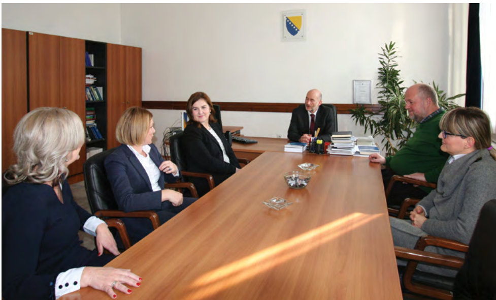
Sastanak Ureda registrara Meeting of the Office of Registrar

This Office shall carry out legal, research and analytical, operational and other professional duties in exercising jurisdiction of the Constitutional Court arising under Article VI(3)(a) and VI(3)(b), VI(3)(c) and IV(3)(f) of the Constitution of Bosnia and Herzegovina. The following duties shall be carried out: processing of the requests for initiating proceedings/appeals and other submissions, including draft decisions and rulings, reports, analysis, notifications and information. This Office also carries out administrative duties concerning the preparation and holding of the public hearings, duties relating to the constitutional jurisprudence and documentation, translation and proofreading and other duties as assigned by the Registrar. Duties arising under the competences of the Office of Registrar shall be carried out in several organisational units and Registrar shall be responsible for operations of the Office in accordance with the needs of the Constitutional Court.