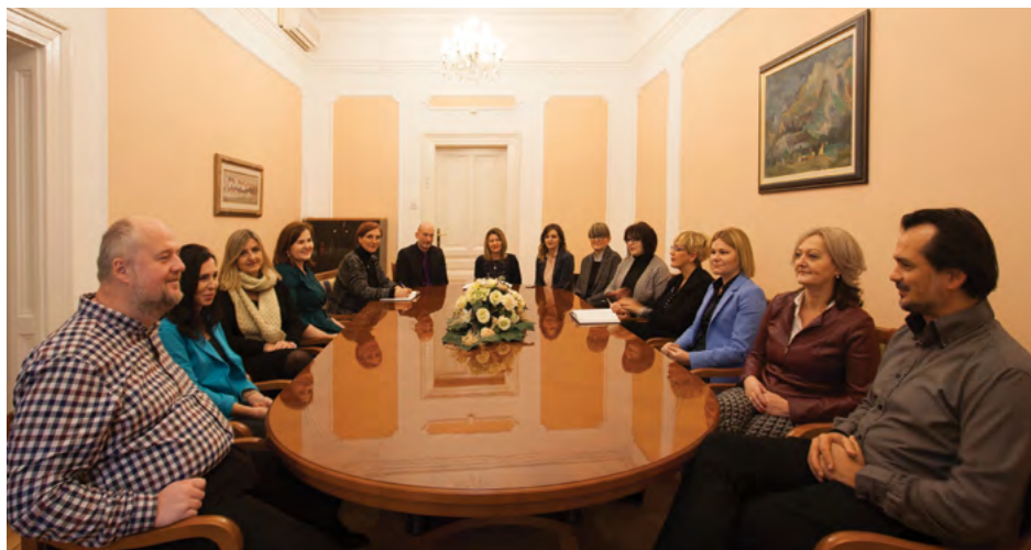
Sastanak Tajništva Ustavnog suda Meeting of the Secretariat of the Constitutional Court