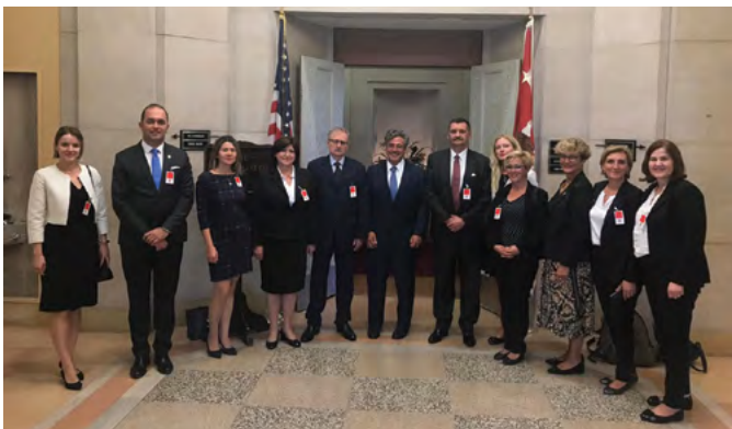
Делегација Уставног суда БиХ у посјети Врховном суду Сједињених Америчких Држава, и другим релевантним институцијама, Вашингтон, септембар 2019. године

Delegation of the Constitutional Court of BiH visits the Supreme Court of the United States of America and other institutions, Washington, September 2019.